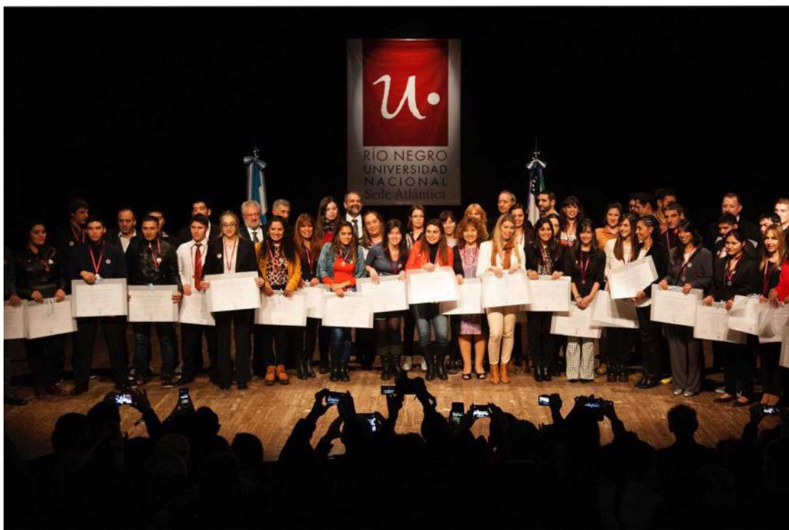
Figura: Con Egresados UNRN.

El 19 de diciembre de 2008 se creó la Universidad Nacional de Río Negro (UNRN), proyecto de ley presentado por el senador rionegrino Miguel Pichetto, quien me convocó para elaborar el estudio de factibilidad. La creación de la UNRN había sido una iniciativa personal en las internas partidarias con Carlos Soria por la gobernación de Río Negro. Por períodos cortos regresaba a mi provincia, Río Negro, desde el regreso al país, en el marco de la militancia política en el peronismo. Fui candidato a vice gobernador por el PJ en 1999, pre candidato a Gobernador en 2002, presidente del Partido Justicialista provincial entre 2003 y 2005, año este último en el que me retiré de la militancia partidaria.