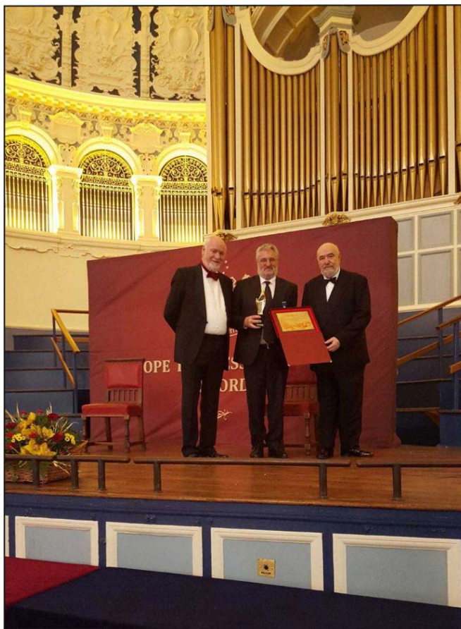
Figura: Premio Mejor Rector Regional, Universidad de Oxford.